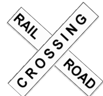
RAILROAD CROSSING SIGN

En adición de obedecer las regulaciones arriba, las siguientes reglas reducirán su posibilidad de ser involucrado en un choque con un tren: